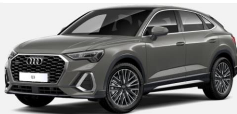
Exterior Versiones Sport