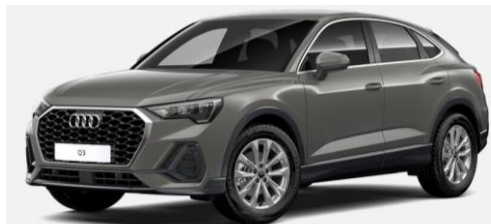
Exterior Versión 35 TFSI